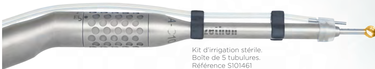
Kit d'irrigation stérile. Boîte de 5 tubulures. Référence S101461