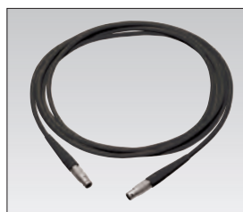
Câble 4 m pour la connexion du modèle filaire et la charge de la pédale "sans fil" sur la console.